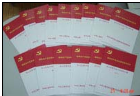
上图:本馆在先进性教育活动中,形成有关文件、学习心得等形成有关稿件200篇,共579页;其中撰写学习心得68份,167页,9万多字;汇编成学习资料15册。